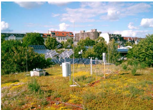
Artenvielfalt in einer Mischung aus extensivem und intensivem Bodenaufbau

selbst begrünen. Der Fachhandel bietet dazu Material und Informationen. „Komplettsysteme“ sind besonders komfortabel für den Selbstbau. In 1-3 Tagen können Sie Ihr eigenes Dachparadies schaffen. Bei großflächigen Flachdächern, Schrägdächern und jeder Intensivbegrünung empfiehlt sich die Beratung durch eine Firma, die auf Dachbegrünung spezialisiert ist. So kann eine fachgerechte Ausführung eine zuverlässige Funktionstüchtigkeit garantieren.