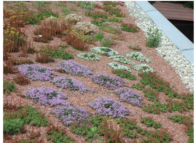
Mit der Dachbegrünung entsteht ein neuer Lebensraum für Mensch und Tier.

Jedes begrünte Dach ist ein Schritt gegen die zunehmende Versiegelung und ein Gewinn für Mensch und Natur. Flugfähige Insekten wie Schmetterlinge und Wildbienen sowie zahl-